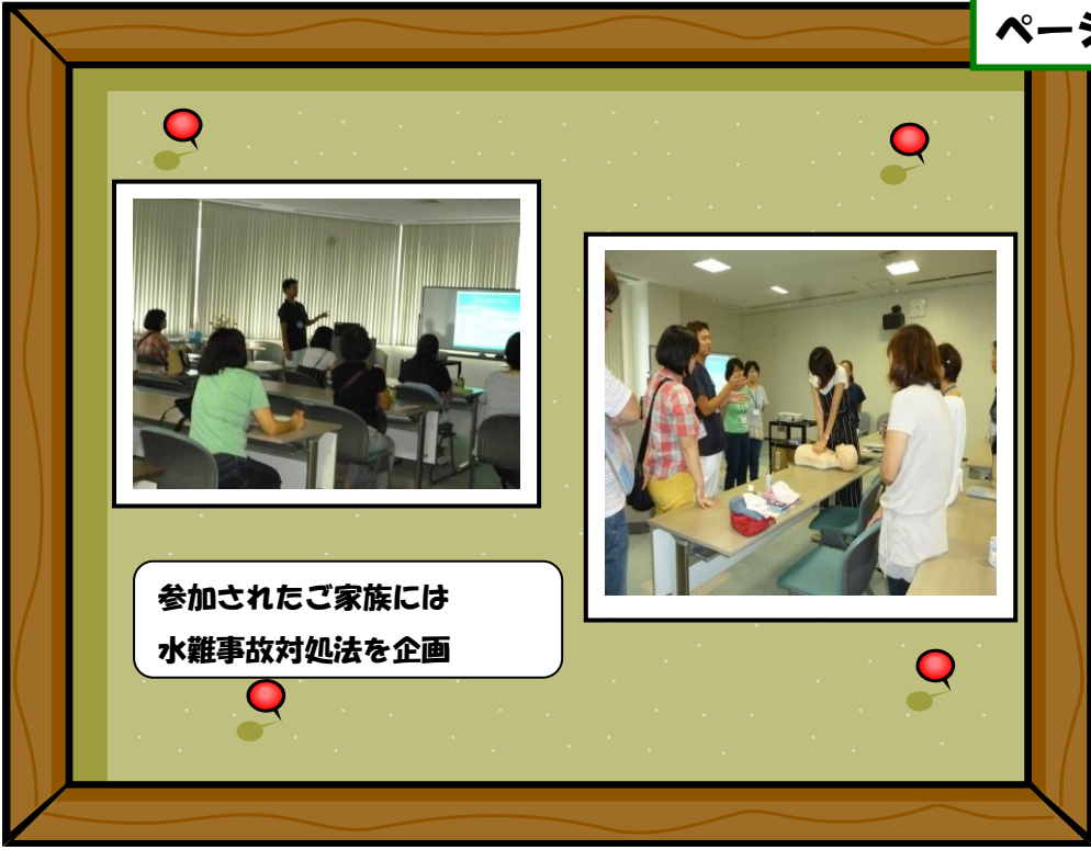
参加されたご家族には 水難事故対処法を企画

参加された皆様からは良かったとの声を多くいただきました。今後も様々な企画を考え地域の皆様に提供していきたいと思えます。 ご参加ありがとうございました