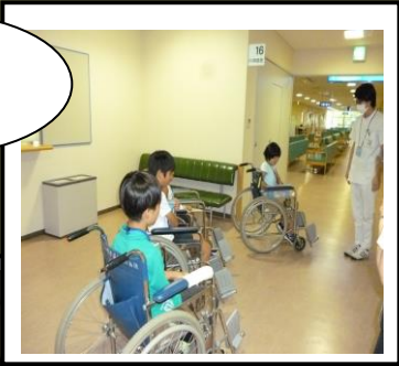
リハビリ 車椅子体験