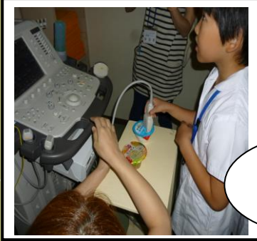
検査科 エコー体験